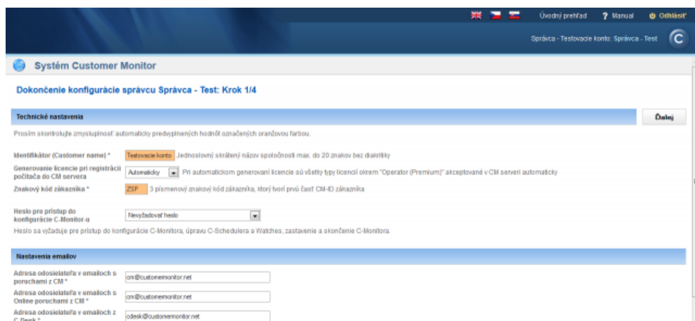
Image: Krok 1, technické nastavenia a nastavenia emailov v CM

Step one offers an option to adjust technical settings of a maintainer, as well as emails in CM, a more detailed description of email settings is listed in the section Activation and scenarios of receiving emails to CDesk [2].